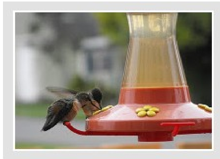
"Hummingbirds Sharing a Flower" by cronewynd http://www.flickr.com/photos/cronewynd/ / CC BY-NC 2.0

Cette image peut être réutilisée à condition : - d'en citer l'auteur (BY) - de n'en tirer aucun bénéfice commercial (NC)